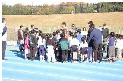
うんどうかけっこ教室