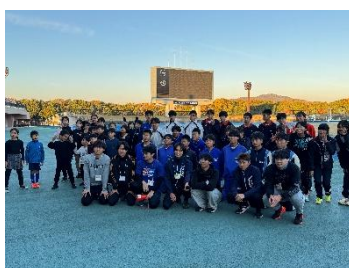
リレーチャレンジ