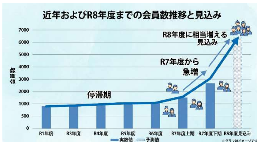
【グラフ：会員数・加盟団体数の推移と未来予測】

2026 年度はかこくらの立ち上げや学校施設利用の改革、新規種目の立ち上げなどもあって、会員数推移のグラフの角度が急坂になるほどの変化を遂げています。スポーツのみならず、文化活動、多くの人の居場所、接点ともなっており、地域になくはならない存在へと変貌していると言えます。